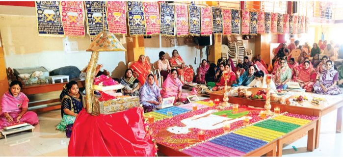
हरिभूमि न्यूज | नलखेड़ा

स्थानीय श्वेतांबर जैन समाज द्वारा पहली बार जैन आगम शास्त्र की आराधना का कार्यक्रम रखा गया। जिसमें समाजजनों द्वारा 45 आगम की विधि विधान के साथ पूजन आराधना कर नगर में शोभायात्रा निकाली गई।