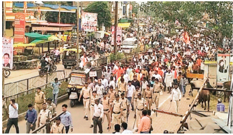
हरिभूमि न्यूज़ ►► ब्यावरा