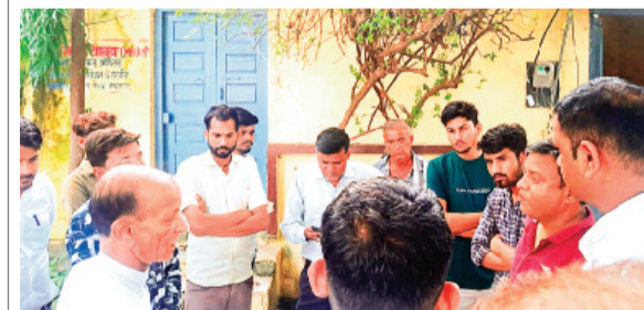
हरिभूमि न्यूज़ ►► ब्यावरा