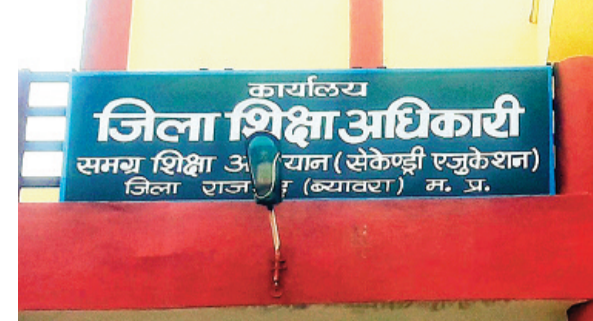
हरिभूमि न्यूज़ ►► राजगढ़