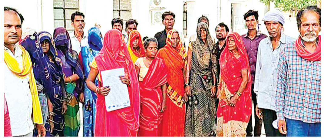
दो-दो हजार रुपए लेने का भी आरोप