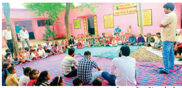
हरिभूमि न्यूज़ ►► राजगढ़

जल जीवन मिशन व अहिंसा टीम की संयुक्त टीम ने किया आयोजन