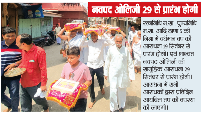
नवपद ओलिनी 29 से प्रारंभ होगी

नगर में चातुर्मास हेतु विराजित रत्ननिधि म.सा., पुण्यनिधि श्रीजी.म.सा. आदि ठाणा 5 की प्रेरणा व पावन निश्राम में पहली बार 45 आगम की आराधना का कार्यक्रम जैन आराधना भवन में आयोजित किया गया। जिसमें बड़ी संख्या में समाज के श्रावक और श्राविकाओं द्वारा एक दिन की उपवास की